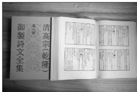
乾隆御制诗文全集