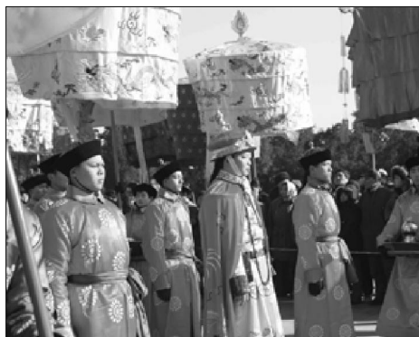
天坛春节祭天活动展演