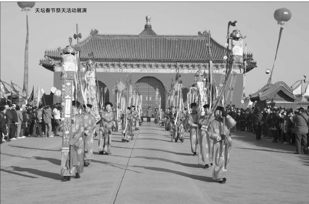
天坛春节祭天活动展演

另一种情况是若上辛日在立春之前则改在次辛：“乾隆十六年正月初九日立春，初三日上辛系在立春以前，改期于十三日次辛行祈谷礼。嗣后如遇斋戒值元旦或上