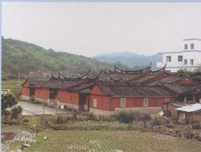
4、高高扬起的燕尾脊古民居（二落带护龙）