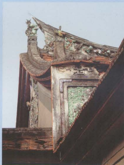
2、屋脊及檐角交趾陶和瓷片粘贴装饰