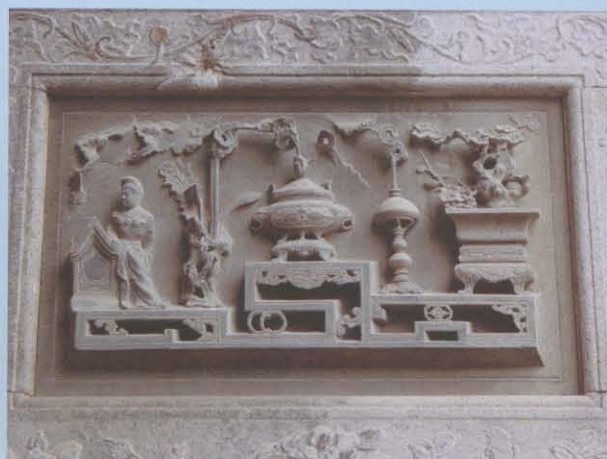
5、墙面镶嵌的石雕板