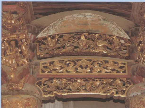
4、梁架上的漆金木雕