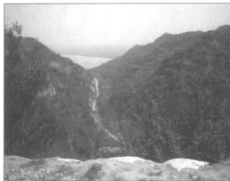
左侧汉王城，右侧霸王城，中间为鸿沟。