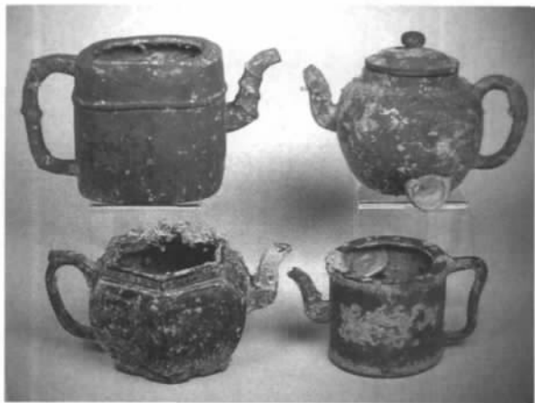
图五// 耿特曼森号之外销茶壶

建立于17世纪后期至18世纪初期的丹麦和德国的皇室收藏,确实为今天的外销紫砂研究提供了非常珍贵的实物例证(另一可以相提并论的