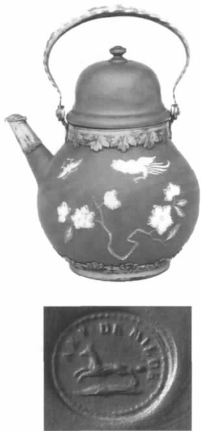
图八// 荷兰米尔登红陶壶(香港茶具文物馆藏)