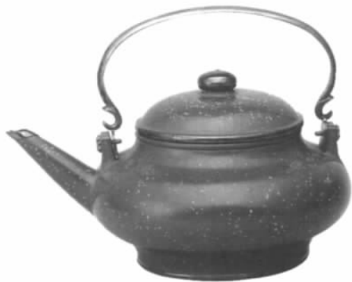
图三// 泰国抛光镶包铜边壶（香港茶具文物馆藏）

开拓东西贸易之欧洲各国，先是葡萄牙、西班牙，继以荷兰、英国，先后执海上霸权。16世纪是葡萄牙人活跃海上贸易的年代。1511年葡萄牙攻占当时已有大量华人聚居的马六甲，继于1557年占吞澳门，将东方的丝绸、茶叶、香料等陆续输往欧洲。葡萄牙后来并入西班牙，霸权亦由西班牙统领。及17世纪，海上优势先后被荷兰及英国之东