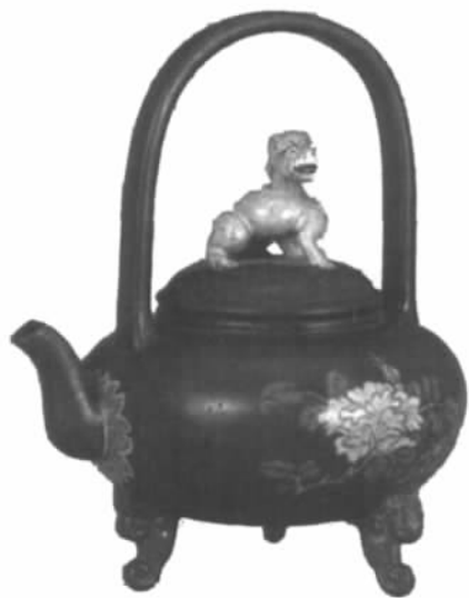
图九// 清康熙珐琅彩狮钮壶 (台北故宫博物院藏)

英国斯塔福德郡的陶瓷传统，乃由移居当地的荷兰陶人埃勒尔兄弟(戴维斯1656~1742年及菲利普1664~1738年)所建立。他们采用当地红土，成功烧造各种仿宜兴之红色器皿，又以模贴花纹及略施白釉为特色。一位曾得到国王查尔斯二世批准生产红色瓷器的专利的德怀特先生，曾起