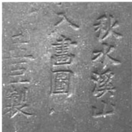
图二// 迪沙如号之孟臣壶