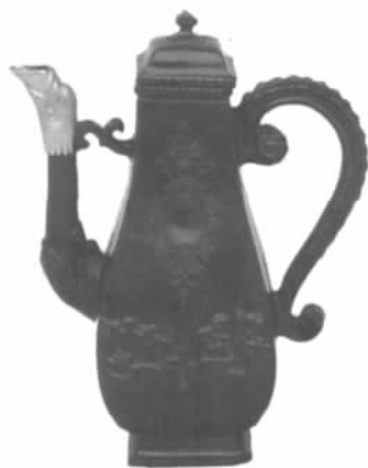
图十一// 德国波格“红色瓷器”(香港茶具文物馆藏)

1703年，特斯蔡霍斯聘用炼金匠波格(1682~1719年)为助手，从此共同研制瓷器，尤其着手解决高温窑炉的建构。1708年，特斯蔡霍斯逝世，波格继续进行研究。以宜兴红陶和德化白瓷为蓝本，