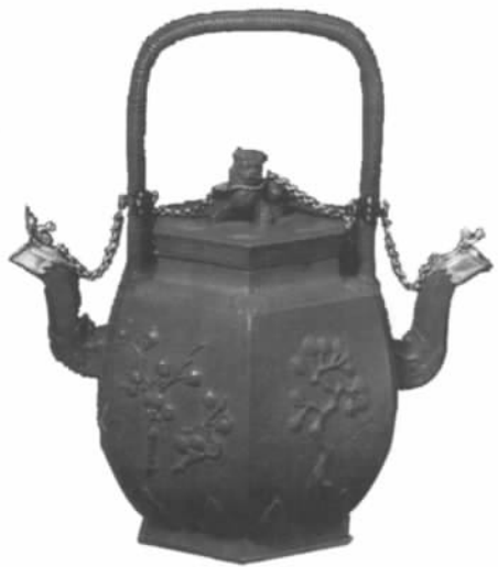
图六// 六角提梁双流茶壶 (丹麦哥本哈根国立博物馆藏)