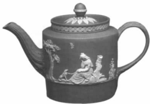
图十// 英国韦奇伍德“扎士巴器”

诉埃勒尔兄弟侵犯其专利，足可反映其成功。在伦敦维多利亚博物馆的藏品中就有埃勒尔兄弟的茶壶作品，其造型特征与宜兴紫砂壶几乎完全一样。