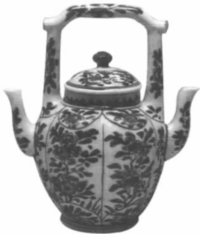
图七// 提梁双流瓷茶壶 (比利时布鲁塞尔皇家艺术历史博物馆藏)