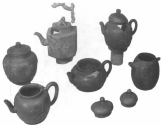
图四// 欧斯特兰号之外销茶壶