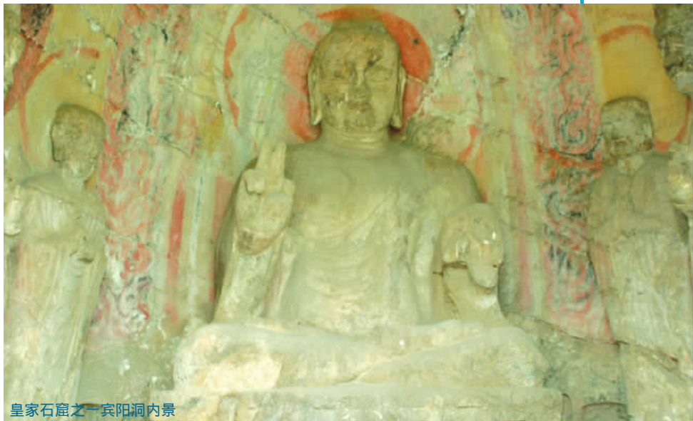
皇家石窟之一宾阳洞内景