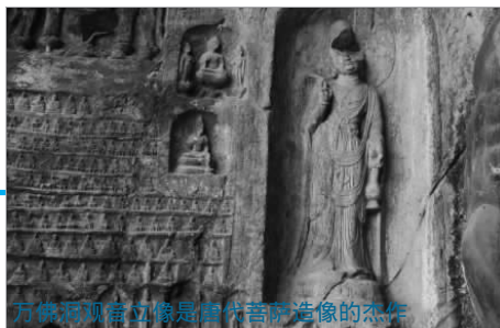
万佛洞观音立像是唐代菩萨造像的杰作