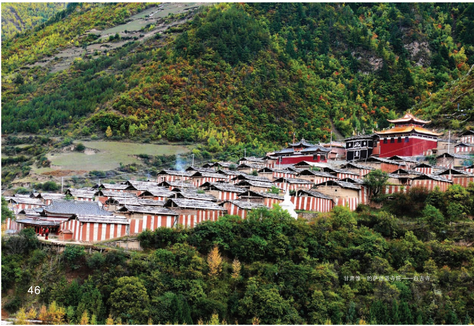
甘肃惟一的萨迦派寺院——白古寺