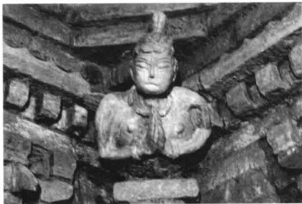
图 11 羽人

第二,将10余块二十四孝内容的模印砖当作普通条砖平砌在墓室顶部,当作普通条砖使用,大大不同于同时期的墓葬。因为以二十四孝为主要表现内容的墓葬装饰,是这一时期较为流行和受重视的题材,也是当时汉文化社会普遍思想信仰的体现。但该墓却将其当作普通建材使用,至少说明在该墓主人