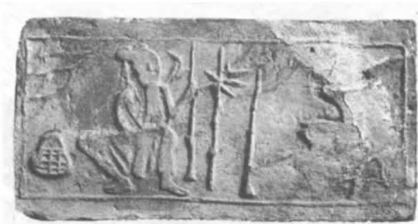
图6 孟宗哭竹模印砖