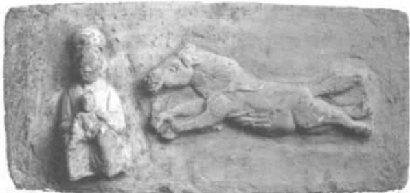
图5 抱孩妇与飞马模印砖

粘贴在成品条砖的砖面上,主要内容有妇人与飞马、妇人与狮子、妇人抱小孩、侍女等。这些模印画像砖根据墓室装饰布局的需要,分别砌筑在墓室各壁不同位置上。该墓所使用的花卉模印砖,模压线条饱满流畅、层次分明,画面疏密有致、构图严谨,具有一定的艺术性。而人物及动物的造型均采用模印贴塑手法,缺少变化,显得千篇一律。原砖面上均有施色,虽淤泥粘损严重,但仍可看到彩绘的遗留痕迹。