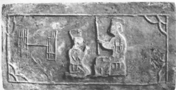
图7 啮指心痛模印砖