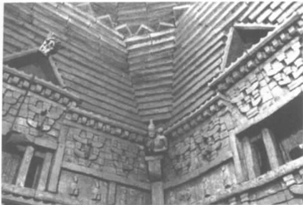
图 1 墓顶西南角

墓室四壁均为四层模印砖立砌而成, 并且排列有一定的规律性, 东、西两壁相互对称。从地面起条砖平砌至第三层为竹节形条砖。其上第一层为壶门花卉模印砖, 第二层和第三层模印砖内容由多种花卉穿插排列。南壁下层门形龕左、右各有一块抱孩模印砖, 下部为妇人与飞马模印砖。其上砌有仿木一斗三升结构的出昂斗拱, 斗拱上托莲花瓣平砖作为和第四层的分割。第四层为妇人与飞马、妇人与狮子、妇人抱小孩等题材的模印砖。之上为一斗多升的出昂斗拱, 斗拱上砌有仿木方形檐椽及檐瓦。再上为仿歇