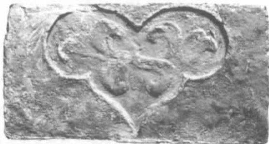
图4 壶门花卉模印砖

该墓除墓顶及墓底用条砖和方砖砌筑和铺就外,在墓室四壁及甬道两侧均使用模印画像砖作为装饰。模印砖内容分花卉、人物和动物。花卉有壶门花卉(图4)、交枝牡丹和莲花、卷草纹;人物和动物有妇人与飞马(图5)、妇人与狮子、妇人抱小孩、神鹿衔草、侍女等。模印画像砖制作方法有两种:第一种为一次模压成形,主要为花卉和神鹿衔草;第二种是人物和动物,是预先模压出人及动物的成形浮雕,然后