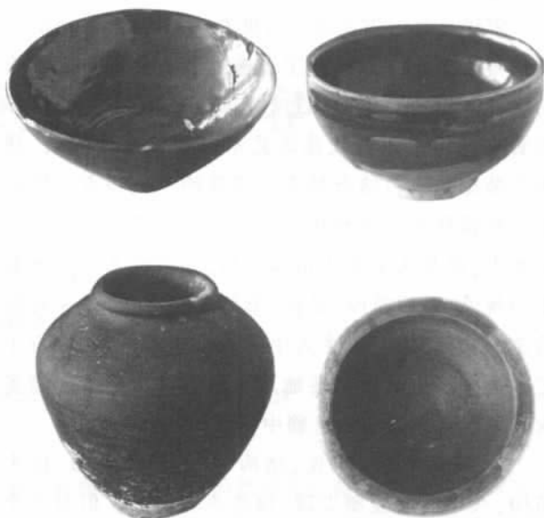
图8 黄褐色釉碗、绛黑色釉碗、灰陶罐、双鱼纹灰陶盆

灰陶兽头2件：其一，单头，塑于长方形基座上，座上穿一孔。悬挂于墓室南壁三角状歇山立面的“山面”上部。陶兽形象独特，奇异生动。高17厘米、宽11.2厘米；其二，形似猪，仅剩上半部。作为镇墓兽放