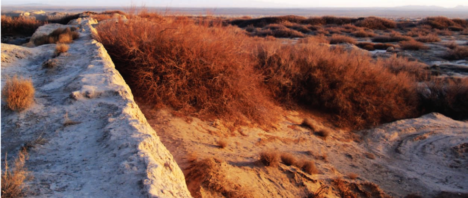
锁阳城的北部城墙