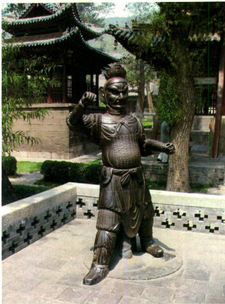
山西晋祠中的尉迟恭铸铁塑像