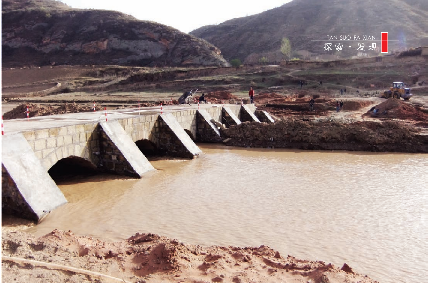
2000年后此处再次修了过水桥

在此基础上修建后重新命名的；其二，这里的居民就是当年游牧民族的后裔或者就是赫连勃勃统一大夏迁徙过来的匈奴人的后裔。或许，他们的祖先就是曾经住在统万城里的市廛百姓。由于大夏国是一个短暂的王国，所以当年的百姓随着国家的灭亡而流落到这里也有可能，再者，赫连勃勃的统万城离这里不远，这种推测是完全有可能的。赫连勃勃修筑统万城以后还在延安修建了一座丰林城（故址在延安李渠镇周家湾）。大夏建国以来，年年都有大规模的战争，生灵涂炭，人口稀少，田畴不毛。赫连勃勃的军事力量又长年保持在30万左右，仅其军需的供应和运输就需要大量的人力、财力。为了军队的调动和军粮的运输，赫连勃勃下令从统万城至长安（今西安，秦汉时期的都城）修筑一条宽30~40米的圣人道。这条圣人道的路线很符合现在我们看到的延安境内的秦直道路线。再则，在内蒙古境内没有一个人将秦直道叫圣人条，这也证实了赫连勃勃修缮秦直道之说。