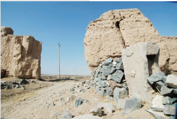
通过城门眺望戈壁