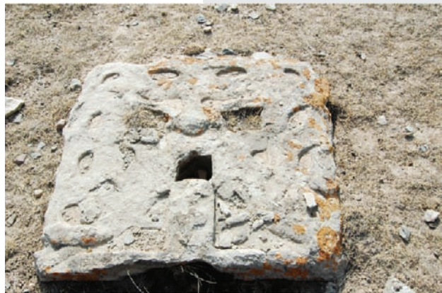
意外发现的虎头碑首