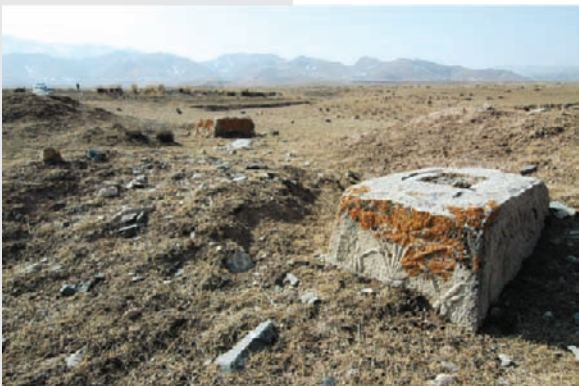
张氏墓地背后就是连绵不绝的群山