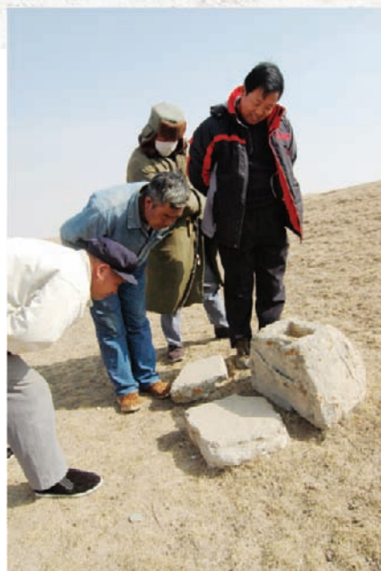
墓地上的意外发现