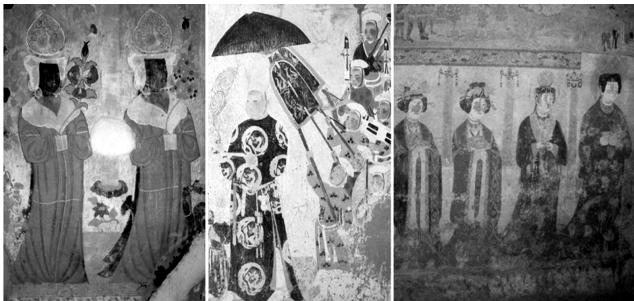
图1 莫高窟壁画中的回鹘服饰形象

领等款式。从新疆境内发现的众多石窟和佛寺遗址,如柏孜克里克石窟、库木吐喇石窟、吐鲁番前山及北庭高昌回鹘佛寺等遗址壁画中可以看出,新疆境内回鹘支系的服饰在9~12世纪期间是基本接近的。而且,与同时期敦煌壁画中的回鹘服饰相比较,发现很多相似之处,如戴尖顶花瓣形冠,穿圆领窄袖长袍的回鹘男子形象分布于新疆境内多个遗址中,在多个敦煌壁画中也有出现,如西千佛洞第13窟、第16窟,莫高窟第148窟、第409窟、第237窟等。根据榜题,人物身份大都是贵族,可见这种头冠和服饰是回鹘贵族男子应用非常广泛的一种服装类型。根据洞窟的营建年代,涉及的时间从9世纪末到12世纪,这类服饰应用的时间也比较久。另外,就服装而言,甘州回鹘女供养人所穿的交领长袍为甘州回鹘所独有。沙州回鹘所穿之对襟长袍在高昌回鹘中多有所见,一脉相承(见图2)。