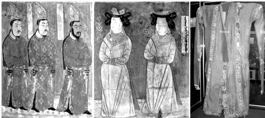
图3 新疆境内壁画与出土的回鹘服饰