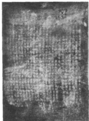
国民党第五战区干部训练团武当训练记