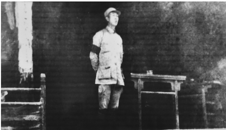
决死一纵队政治委员薄一波同志在牺牲烈士追悼大会上讲话(1939年)

机关之所以选择在阎寨一带驻扎,首先是由于沁源位于岳北13个县的中部,距离同蒲路和白晋路都在百里之外,日军不容易奔袭。其次是沁源群众基础好,党的地下组织力量大。第三是沁源四周山高林密,丘陵起伏,宜于游击,利于进退攻守。第四是阎寨村背靠土岭,村前地面开阔,东面靠山,西面靠沁河,与区党委、行署驻地都相距不远,联络方便,一旦有情况容易转移。