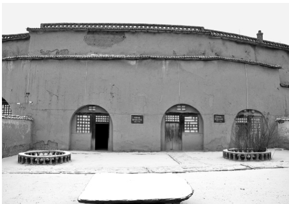
太岳军区领导同志曾经住过的窑洞

师派出陈赓旅长率三八六旅进入沁源,靠近决死一纵队配合反顽作战。这样,太岳区的党政机关在1939年秋天就从沁县全部转移到沁源。