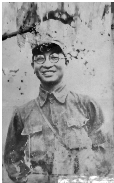
太岳军区司令员陈赓同志