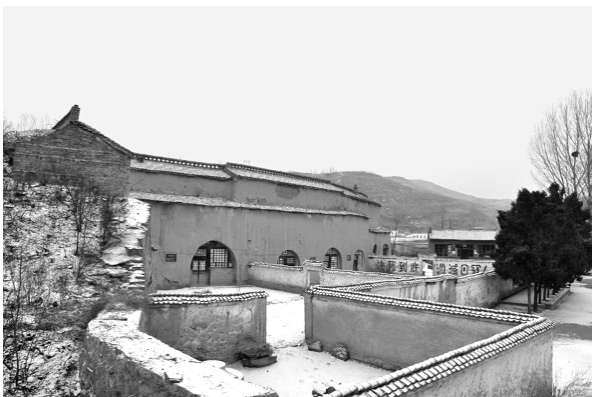
太岳军区司令部旧址