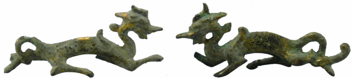
图二// 鎏金铜龙(出土 1339、1340)

大玉简(出土1160-19),纵37.9、横9.9、高2.0厘米;小玉简(出土1160-20)纵35.7、横7.5、高0.9厘米。玉简均为长方形,大理石磨制而成,其中较小者表面似有纺织物的痕迹。均有字,但其余两简文字已残缺不全或模糊不清,大玉简文字清晰可见。此简正面阴刻六行楷书“嗣天子臣 恒 上为