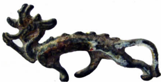
图四// 铜龙(出土 1342)