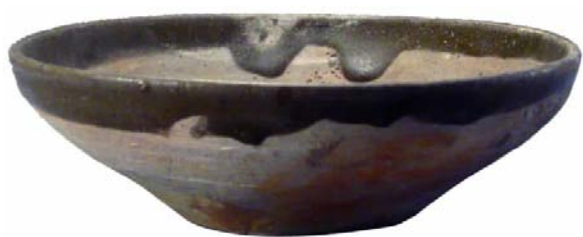
图六// 斜腹青瓷钵(集 1159:15)

宗庙下为群生请福祈恩消灾散咎谨就/玉清昭应宫太初殿命道士□十一人开启金籙大斋二七日伏奠和天安地保国宁民恭祷/嘉灵别陈大□今以告祈已毕斋事周圆谨以旧式诣/苏州林屋□□□□金龙玉简□神愿仙飞行上□五岳真人至圣至真□□□□□闻/天□三年岁次戊□九月庚申朔十日乙巳斋□内告文”,背面正中阴刻楷书“入内侍省内西头供奉官臣王从政”。此简已断为两节,光素无纹(图五;彩插四:4)。小简下半段残留“谨依旧式诣……奉……源观道场内吉时拜上”。仅存半段者,残存部分为上半段,经仔细辨认,可