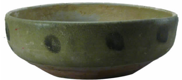
图七// 青瓷褐斑钵(集 1159:14)