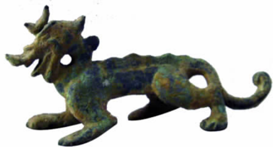
图三// 铜龙(出土 1341)