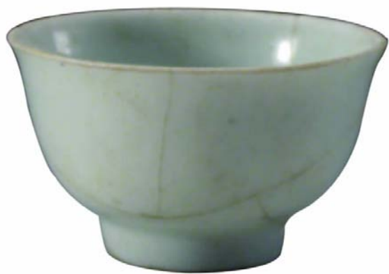
图八// 白瓷杯(集 1160:21)