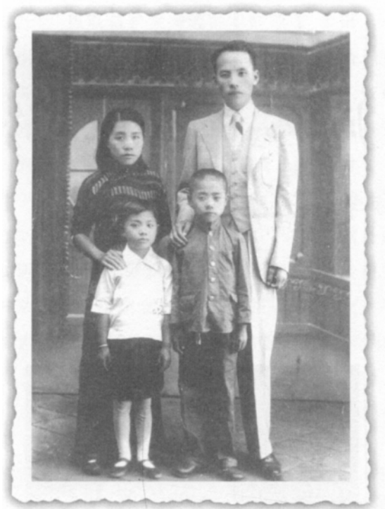
童年安上与父母妹妹

来清池和尚住持清修院,北洋政府总统徐世昌题匾额“清修禅院”。后军阀混战,直鲁联军进驻天津将清修院封闭。1928年北洋政府倒台,清修院重归李家。1933年勒云鹏联合孙传芳与李春城的长孙李颂巨商妥,将清修院改为“天津居士林”,勒云鹏任林长,孙传芳为副林长,规定每周日居士来居士林诵经,由富明法师讲经,当时信徒甚多,达千人以上。后来由于侠女施剑翘刺杀孙传芳后,勒云鹏也离开了,居士林日渐萧条。