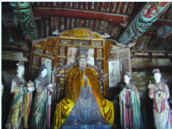
图一 玉皇大帝及侍女塑像

玉皇殿中间所塑的就是玉皇大帝,他是封建皇权在天神体系中的象征。在民间信仰中玉帝俨然是一位人间帝王,是天神地祇中的最高神。所以民间对玉皇大帝的信仰远远超出了道教崇奉的“三清”。早在上古时期,由于人们对自然界的无知,他们便把各种自然界超出人力的现象和事物,想象为各种自然神。山川河流、日月星辰、风雨雷电等都被认为是由各自的神灵支配。到等级观念出现后,人们便认为天神地鬼中也一定像人间一样拥有一位至高无上的统治者,这就是后来的玉皇大帝。晋城玉皇庙玉皇大帝的形象便模仿人间帝王的打扮,身着九章法服、头戴十二行珠冠冕旒,手持玉笏,威严肃穆。两旁是他的宰辅臣尉和嫔妃侍女(图一)。玉皇殿的东西