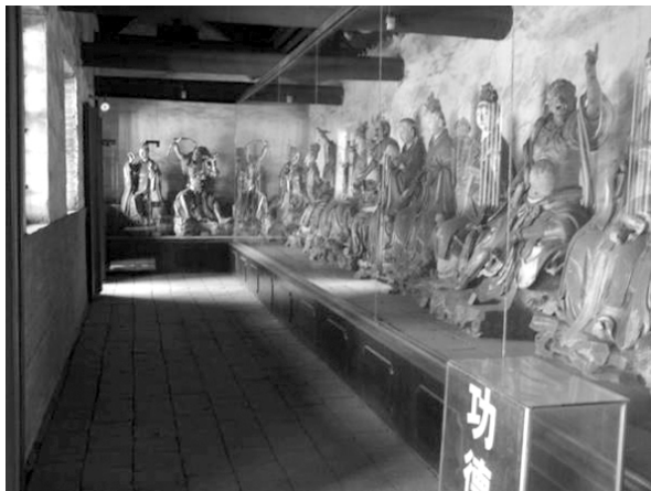
图二 二十八宿殿塑像全貌

二十八宿殿塑有玉皇庙彩塑之冠——二十八宿星君像(图二)。这里的每一个塑像代表天上的一个星座。关于二十八宿的记载最早见于战国时期,它起源于周朝,当时朝廷任命冯相、保章二人职掌天