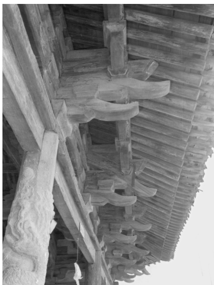
正殿前檐柱头铺作