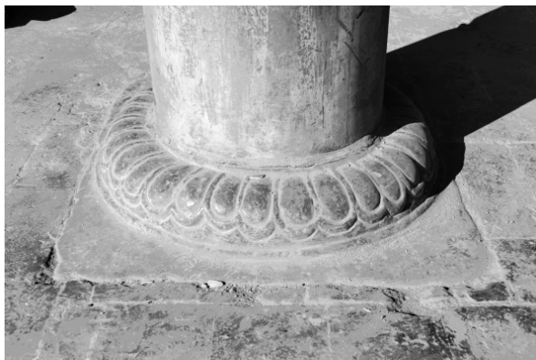
正殿宝装莲花柱础