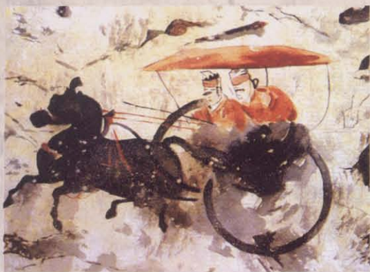
图一 偃师杏园东汉墓局部