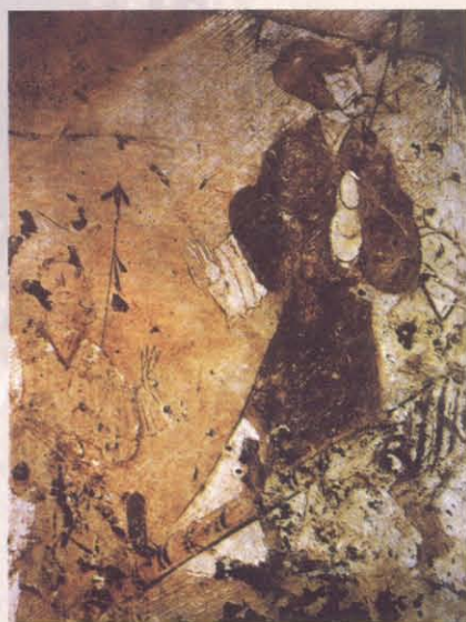
图七 上林苑训兽图局部