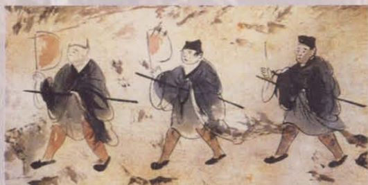
图三 车马出行图局部