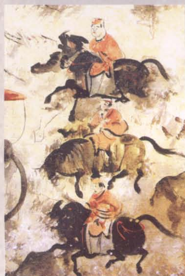
图十 偃师杏园东汉墓