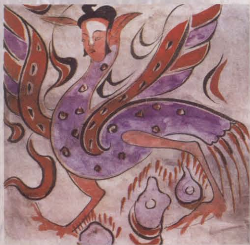
图四 上林苑驯兽图