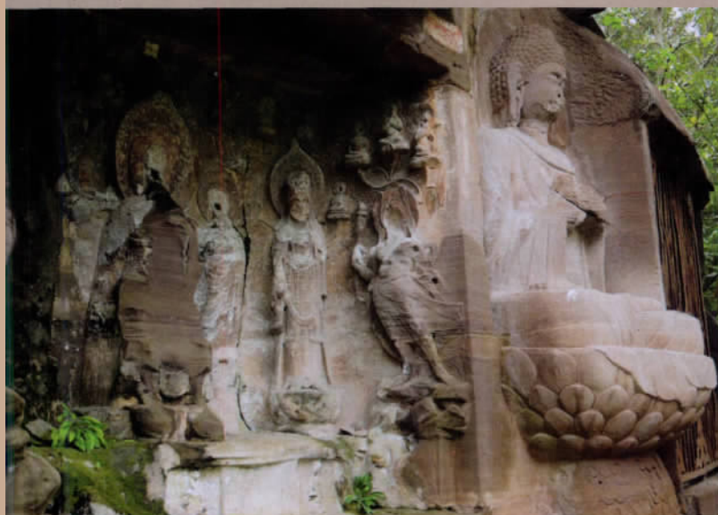
卧佛间被破坏的造像