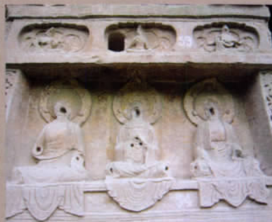
卧佛沟被破坏的佛像