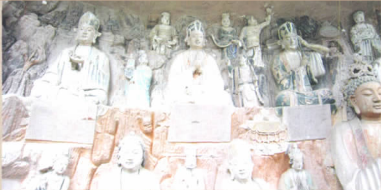
柳本尊十炼图