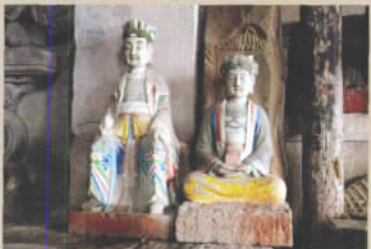
华严洞,窟内一旁所立石像,后人重新妆彩