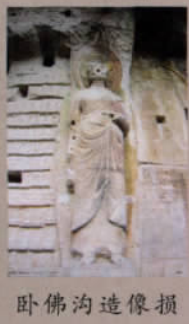
卧佛沟造像损坏较为严重