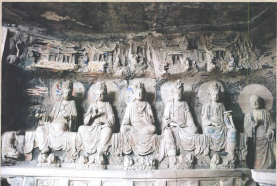
华严洞中的石刻

一个狭长的山沟当中,五代后逐渐荒废,一直不为外界所知,也令该处石窟保存完整,直到1987年的文物普查才被重新发现。在盛行砸佛像的“文革”期间也因为民风淳朴,不但得以保存,还香火常驻,如盛唐两宋间一般,佛出于民间,生息于民间。这么多年,外界翻天覆地,但佛像在这里与青青的稻田,微风的谷间,田间的小鸭子以及日出而作日落而息农村的生活相伴度过了巍巍岁月。