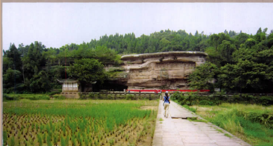
佛刻在静谧的乡野中

卧佛沟石窟造像风格与洛阳龙门奉先寺造像风格一致, 为中国盛唐时代佛教石窟的辉煌孤本。因为位于