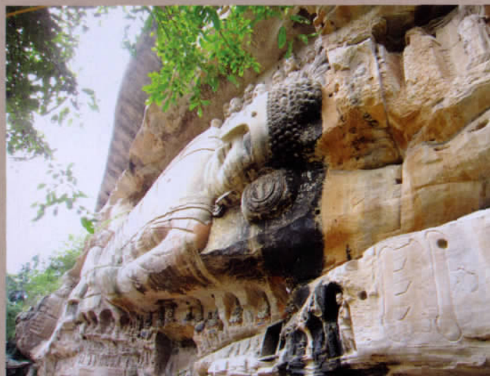
卧佛头部熏黑处是 20 世纪五六十年代, 一家五保户住在这里, 灶台的烟熏所致