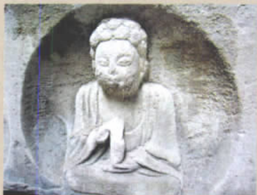
毗卢洞,供养人像,旁边还刻了名字