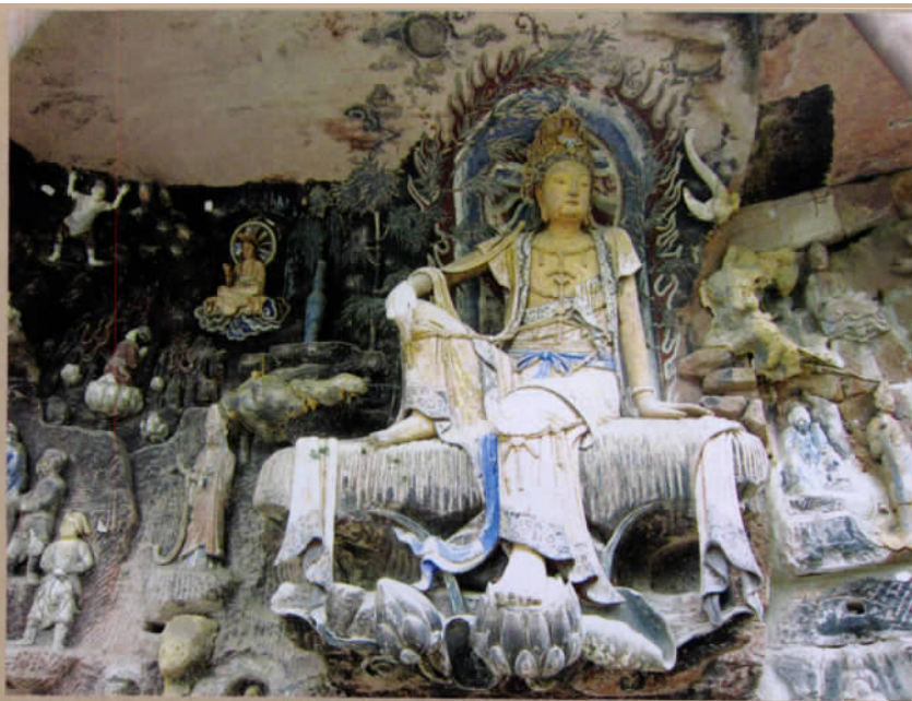
紫竹观音及群雕堪称艺术精品