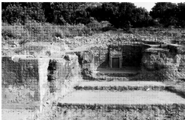
图六 陈邓氏墓修复前状况图

但从墓葬地面形式及族谱、碑文等史料的分析,还是可以较清晰地了解广府民系的丧葬习俗。