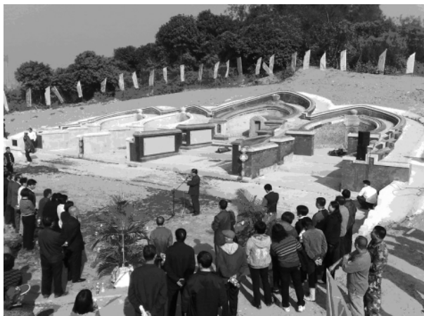
图八 陈莲峰墓修缮工程典礼仪式

2009年元月,陈莲峰墓群维修完毕并进行隆重的竣工典礼(图八)。不仅将四座墓葬缺损的墓堂墙壁表层、墓碑、碑框、墓顶宝珠等修复好,也将各自墓堂、祭台、拜台、伸手