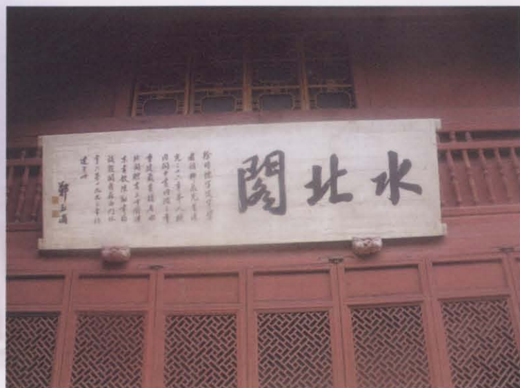
图六 天一阁南园水北阁