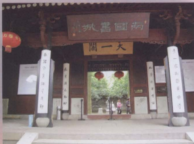
图一 天一阁西大门