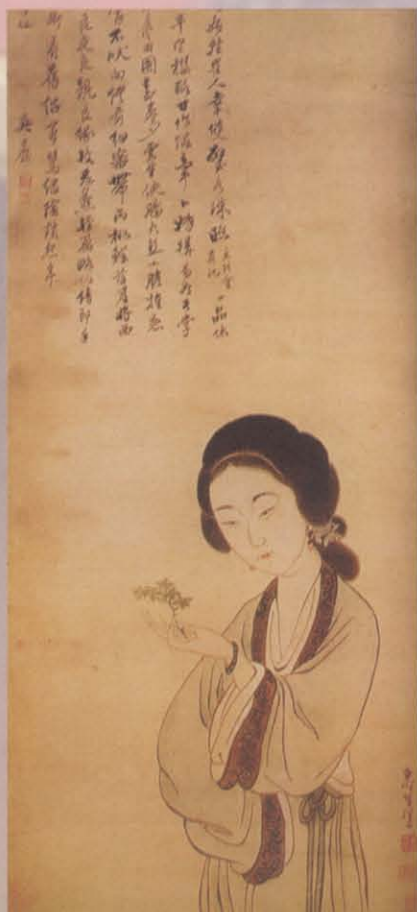
图三 天一阁藏仕女图(清)