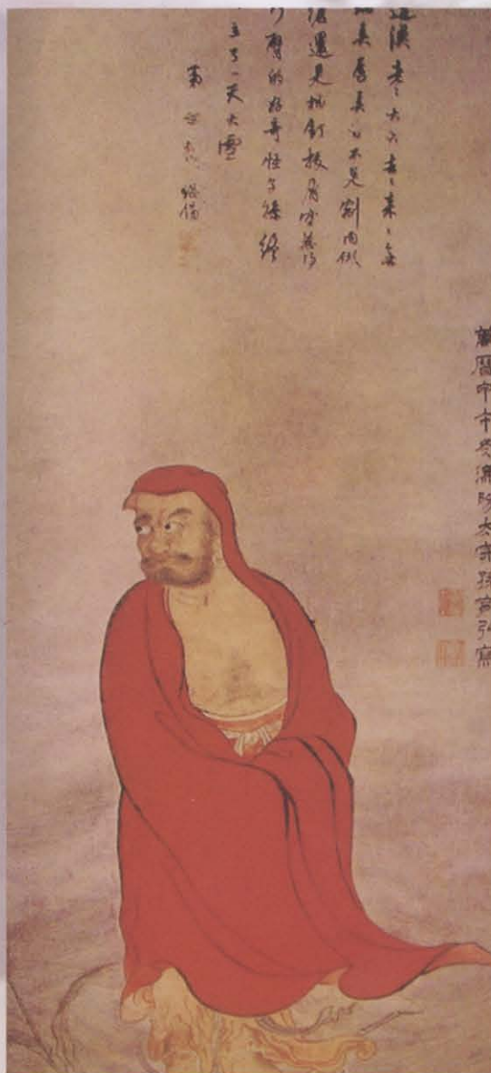
图九 天一阁藏达摩渡江图(明)