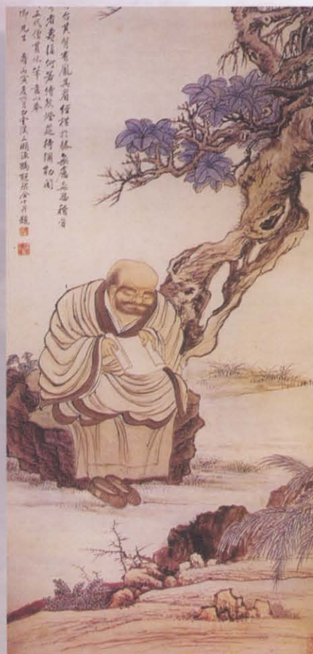
图二 天一阁藏罗汉图(现代)