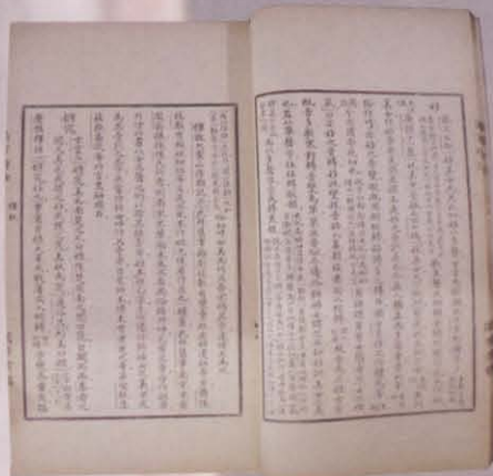
图四 天一阁藏《雨言稽古》