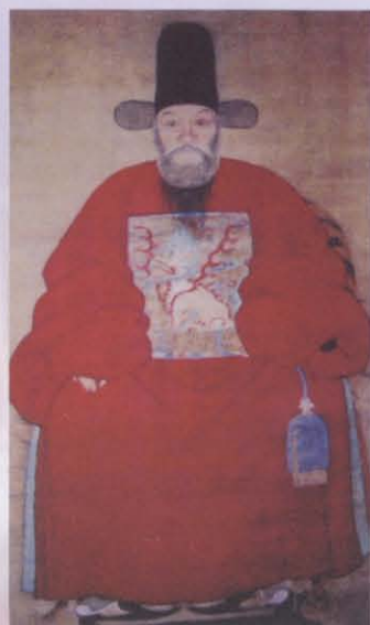
图五 天一阁缔造者 范钦画像