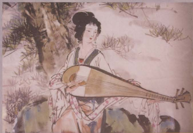
图八 天一阁藏仕女图(当代)