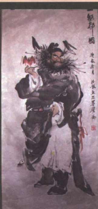
钟馗是中国民间传说中驱鬼逐邪之神。相传他生得相貌奇丑，但却是个才华横溢、满腹经纶的风流人物。他以贡士第一名的成绩入围殿试，却因奸相卢杞以貌取人、选进谗言而落选状元。钟馗一怒之下头撞殿柱而死，皇帝最后只好下诏封钟馗为“驱魔大神”，并以状元官职殡葬。

他当宰相时，经常鼓动皇帝削弱将军和各地节度使的兵权，使得许多原本没打算反叛的地方势力被逼造反。之后卢杞又建议皇帝强硬处理，不停地讨伐他们。这样一来，各地的割据势力越来越多，而朝廷的军费开支每月超过百万缗。