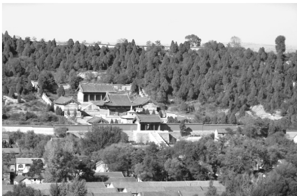
图三 法兴寺俯视全景