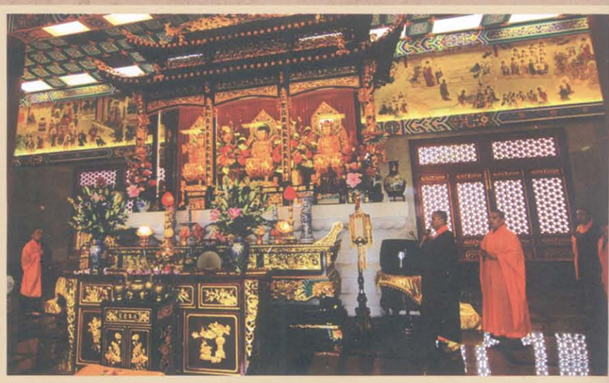
香港西方寺大雄宝殿