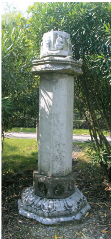
图三 德清永宁寺经幢