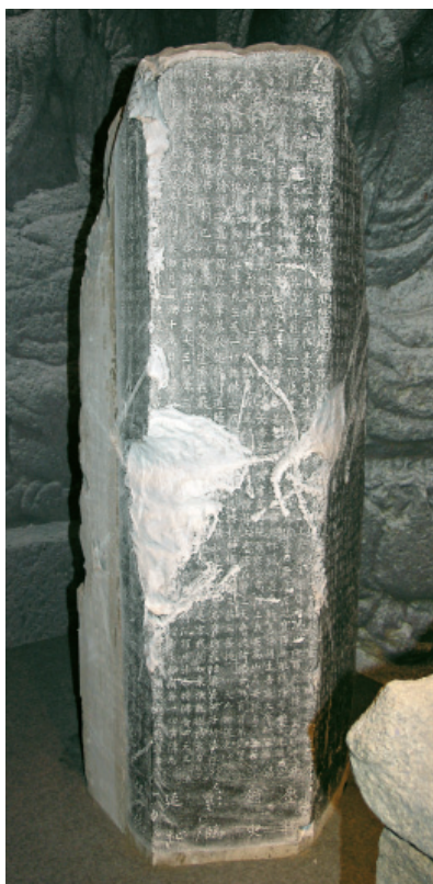
图四 湖州博物馆藏经幢