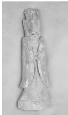
12.五代灰陶“王”字冠侍俑 (藏 1:3100)