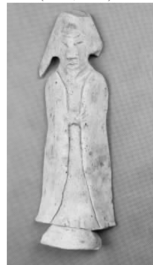
8.五代灰陶风帽侍俑 (藏 1:3096)