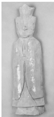
2.五代灰陶三角冠 (藏 1:3090)