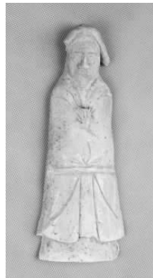
14.五代灰陶戴风帽侍俑 (藏 1:3102)