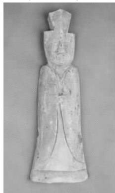
6.五代灰陶三角冠侍俑 (藏 1:3094)