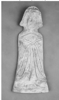
17.五代灰陶女侍俑 (藏 1:3105)