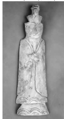
19.五代灰陶双层冠侍俑 (藏 1:3107)