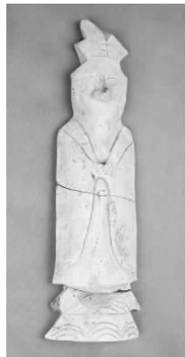
13.五代灰陶“王”字冠侍俑 (藏 1:3101)