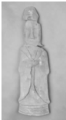
11.五代灰陶“王”字冠侍俑 (藏 1:3099)