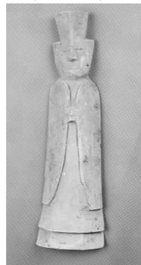
7.五代灰陶三角冠侍俑 (藏 1:3095)