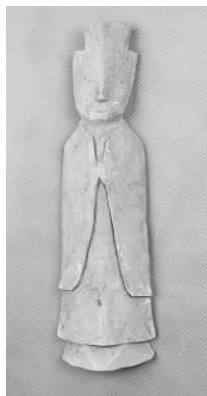
4.五代灰陶三角冠侍俑 (藏 1:3092)