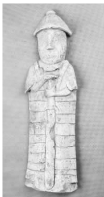
1.五代灰陶武士俑 (藏 1:3089)