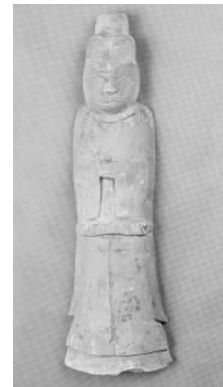
9.五代灰陶幘头帽侍俑 (藏 1:3097)