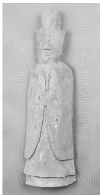
3.五代灰陶三角冠侍俑 (藏 1:3091)