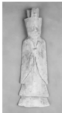
5.五代灰陶三角冠侍俑 (藏 1:3093)