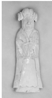
15.五代灰陶女侍俑 (藏 1:3103)