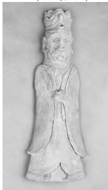
18.五代灰陶戴冠侍俑 (藏 1:3106)