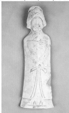
16.五代灰陶女侍俑 (藏 1:3104)