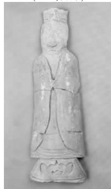
10.五代灰陶戴冠侍俑 (藏 1:3098)