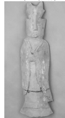
20.五代灰陶双角冠侍俑 (藏 1:3108)