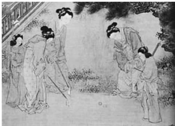
图三 明杜堇《仕女图》(上海博物馆藏)

期,捶丸活动也流行达官贵人、皇家贵族之中。《捶丸集序》记载“宋徽宗、金章宗皆爱捶丸”。入明以后捶丸运动还被引入宫中,作为宫廷的游乐项目。现藏于故宫博物院的《明宣宗行乐图》(图二)描绘的就是明宣德皇帝朱瞻基亲自持棒参加捶丸活动