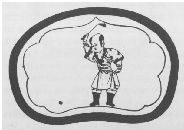
图一 宋代磁州窑捶丸图瓷枕(故宫博物院藏)

到了宋代,捶丸已经成为当时社会上一种崭新的体育运动。现存于故宫博物院收藏的一件宋元时期北方著名的磁州民间窑场生产的白釉墨彩瓷枕,枕面绘有戏耍捶丸图(图一),它是当时捶丸运动在