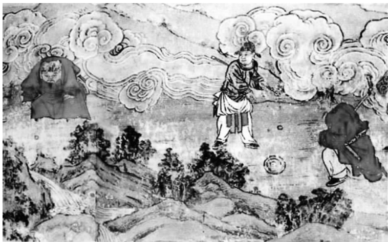
图六 山西洪洞县水神庙元代《捶丸图》壁画

能进行政府间的官方往来。直至 14 世纪后期朱元璋灭元建立明帝国后,才与日本室町幕府建立以宁波为口岸的“十年一贡”中日勘合贸易关系。