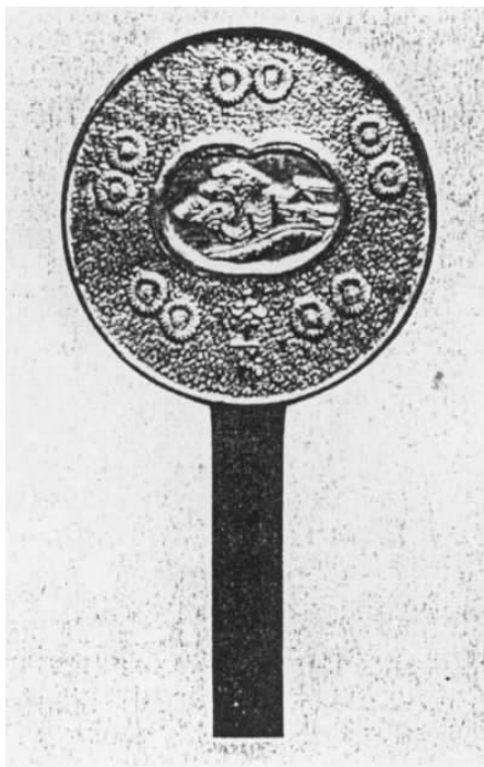
图五 《捶丸图》日本铜镜 (采自日本·前田洋子《柄镜的变迁》)