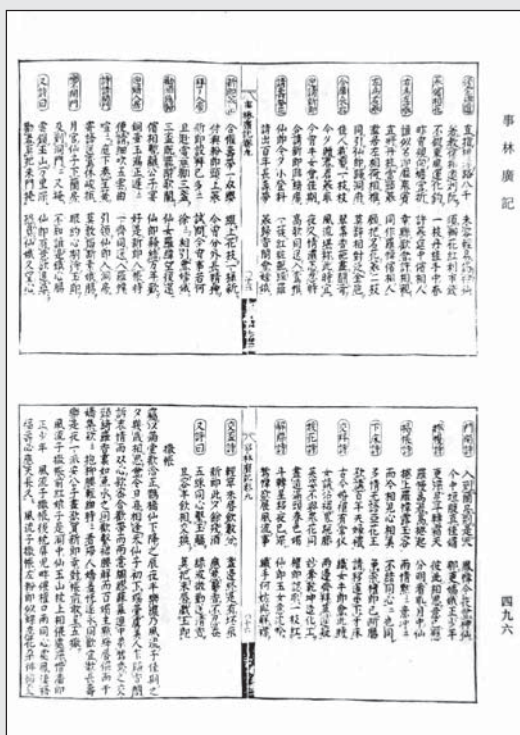
和刻本《事林广记》书影