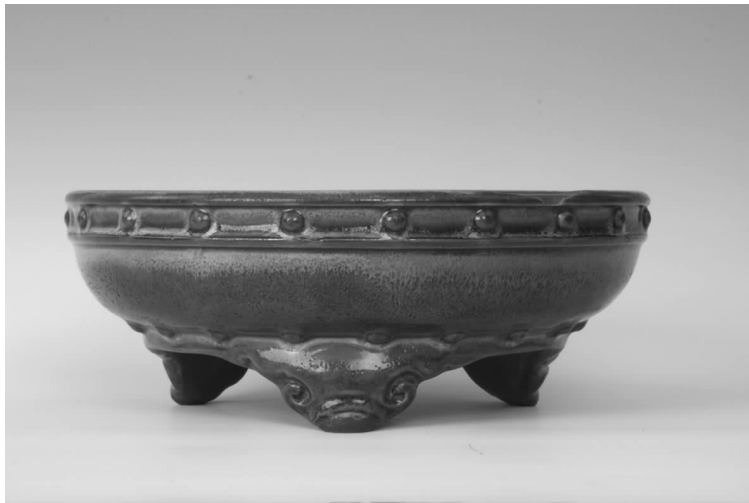
青岛市博物馆藏 宋钧窑洗