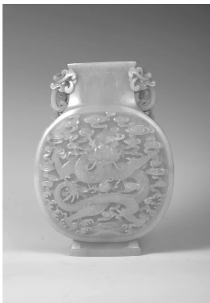
青岛市博物馆藏 清代白玉扁壶