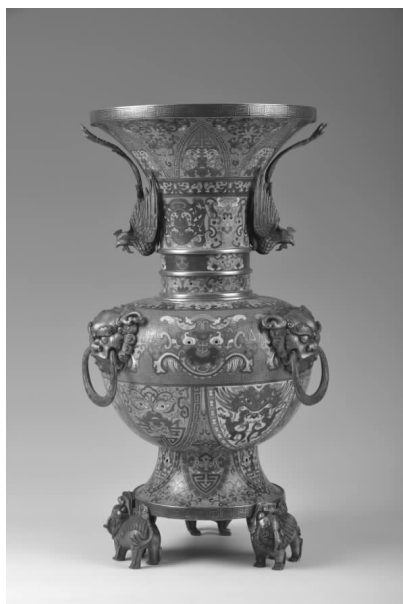
青岛市博物馆藏 清代珐琅尊

青岛市博物馆的陈列及内部配套设施进行改造完善。在上级部门的指导下,青岛市博物馆立即制定了改陈的总体思路并组织专业人员赴外地考察,学习兄弟馆改陈的先进经验及展陈理念。承担此次改陈的内容设计专业人员在撰写方案的同时,开拓思路,注重紧紧把握时代脉搏,强化精品意识,努力创造思想性与艺术性、科学性与观赏性、教育性与趣味性完美结合的精品展览,改变了传统展览单项灌输的教育方式,注重展品与观众的交流与互动,博采众家之长。在上级部门的配合下,聘请国内资深的文博专家,对青岛古代史与近代城市发展脉络的“青岛史话”大型基本陈列以及“百工奇技——馆藏古代工艺品艺术陈列”、“彩瓷聚珍——馆藏明清瓷器艺术陈列”、“古钱今说——馆藏古代钱币陈列”、“乡间画记——馆藏山东民间木版年画艺术陈列”、“左臂丹青——高凤翰书画艺术陈列”等6个艺术专题陈列的内容方案把关,他们组织方案撰写人员讨论、修改、最终定稿。这些基本陈列内容设计的成型为形式设计工作提供了有利的帮助。