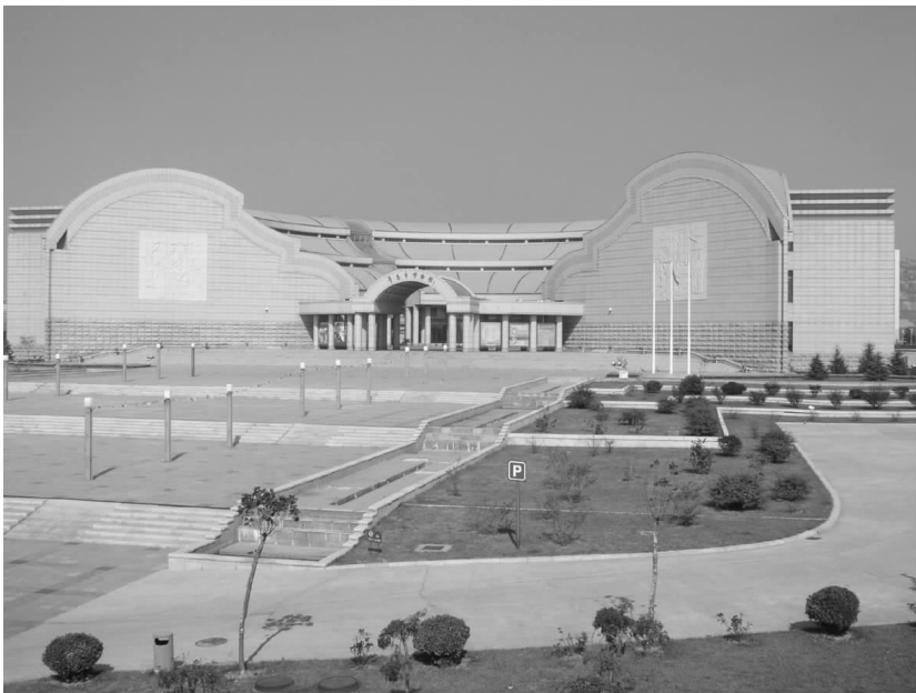
青岛市博物馆新馆

1987年青岛市博物馆举办的大型《青岛风物展》，深受岛城人民的喜爱，该展览集中介绍了青岛市几十家大中型企业的厂容厂貌及名优产品的实物。该展览题材新颖，内容丰富，当时从各大企业征集实物两千余件，这是青岛市博物馆自建馆以来举