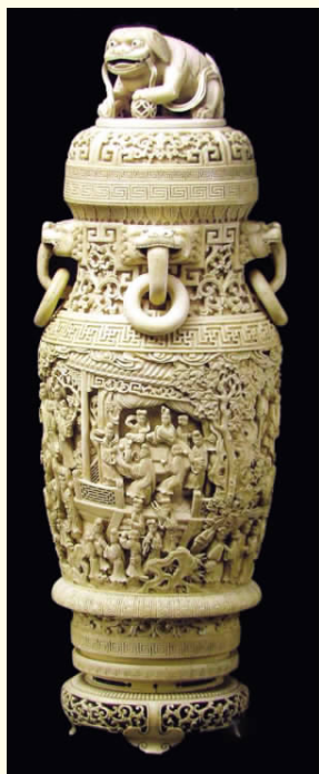
图三 象牙红楼梦人物故事瓶 清 山东省博物馆藏