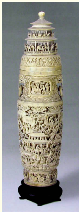
图二 象牙镂雕人物塔式瓶 清 扬州博物馆藏