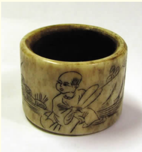
图七 扳指 骨制品

象牙系大象上腭的门牙，可分牙皮与牙心。象牙根部中空，与骨头相连，称牙管，中部已露出象口外，为半空心。牙尖占 1/3 实心，是用于雕刻部分。象牙自牙头开始，有一小黑点，一直延伸到空心的管口部心，称之牙心。如横切象牙尖，就大致分为太阳心、芝麻心和糟心。象牙的牙心以太阳心最好，芝麻心次之，糟心最差。