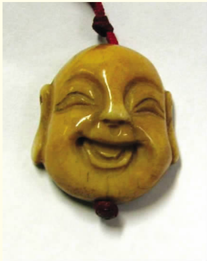
图八 佛头 骨制品