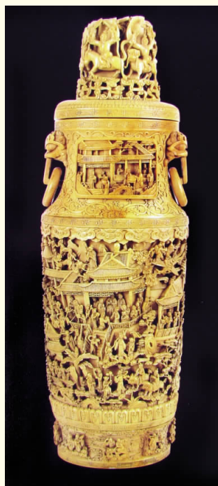
图四 象牙雕刻人物瓶 清 南京博物院藏

洋 增进了中国与西亚、非洲各国的经济、文化交流，也使象牙由远而至。到了清乾隆年间牙雕最兴盛，其制作可分宫廷造与民间造之分。而广州的象牙货源充足，雕刻以纤细精美而著称。北京、台北故宫博物院珍藏的一批透雕云龙纹象牙套球、镂雕夔纹象牙香筒、群仙祝寿象牙塔、编织象牙丝纨扇和编织象牙席等作品，雕琢精细，精巧绝伦。扬州博物馆、山东博物馆、南京博物院藏清代象牙镂雕人物瓶，采用了镂雕、浅刻、微刻等各种技法，层次丰富、气势磅礴(图二、图三、图四)。中国的象牙器在世界文化宝库中独树一帜，闪耀着迷人光辉。