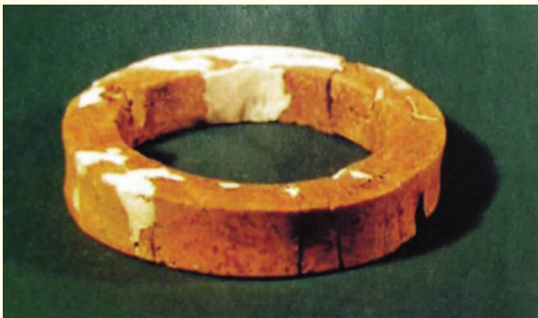
图一 象牙镯 新石器时代 江苏昆山赵陵山墓 77 出土 南京博物院藏

明清时期是象牙器雕刻工艺的高速发展期,象牙原料大多来自国外。明初,郑和带领船队七下西