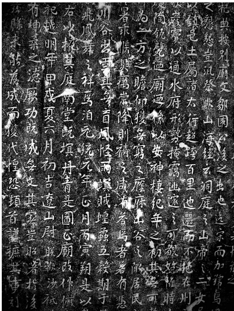
图四 《山昭懿圣母庙记》

众多碑碣中,极具考古价值的有镌刻于明洪武二十年(1387年)前后的《新修十八盘并天井郊城堡图碑》,现存于羊角乡盘垳村黄泽关。碑额圆首,碑座遗失,高141厘米,宽71厘米,厚23厘米。碑额楷书“新修十八盘并天井郊城堡图”。石匠王自强刻石。按黄泽关所立明万历三十四年(1606年)《重修武安王庙工竣记碑》所载,“缘自我太祖高皇帝藩封恭王入晋,钦命行军大司马高巍火暖崇岗,林石焚爆,开山凿路,上筑堡寨,内设巡检司”,此事当在洪武二十年前后。当时朱元璋为加强中央集权制,曾下令在全国丈量土地并绘制图形,在此基础上实行里甲制和关律制。关律制规定在全国“冲要去处”,分设巡检司盘查行人。十八盘为山西通往河北的关隘要冲,因而设置了巡检司,修筑了城堡,并有相当规模的兵员马队常年驻守。《城堡图》(图五)详绘了当时城堡的规模及城堡内外的地理图形与有关建筑设