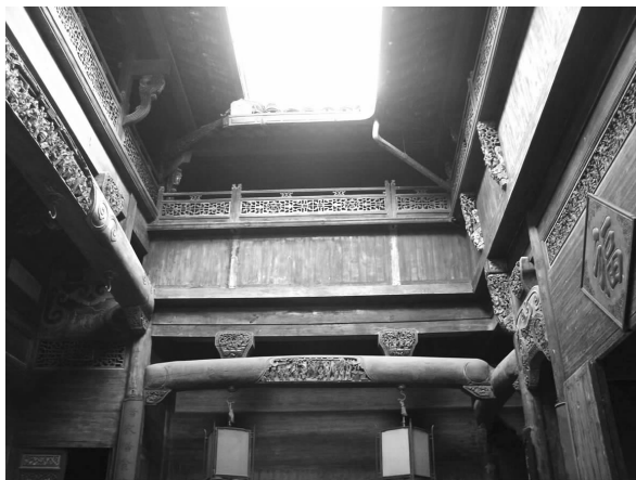
图一 徽派民居天井