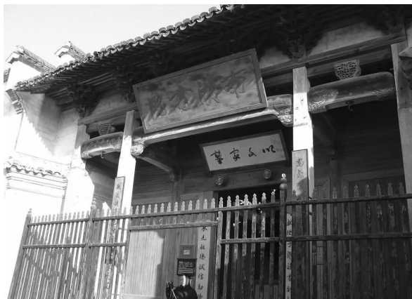
图七 宏村南湖书院