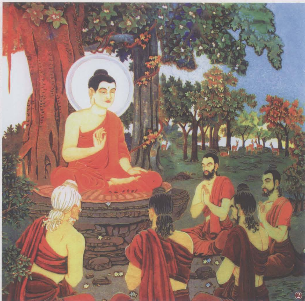
② 初转法轮：佛陀成道后，在波罗奈城的鹿野苑，度化阿若憍陈如等五位侍者。