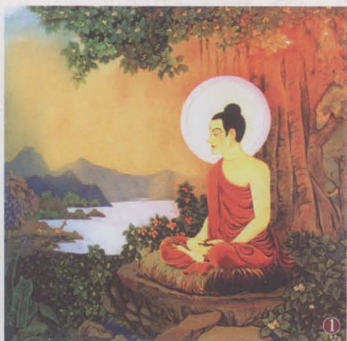
① 豁然大悟：太子独自于毕钵罗树下静坐沉思，终于在十二月初八日凌晨，大彻大悟。