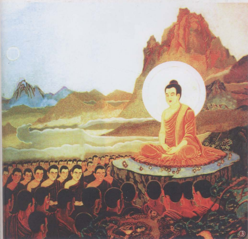
③ 说法度生：佛陀在“竹林精舍”，向一千二百五十位比丘说法。