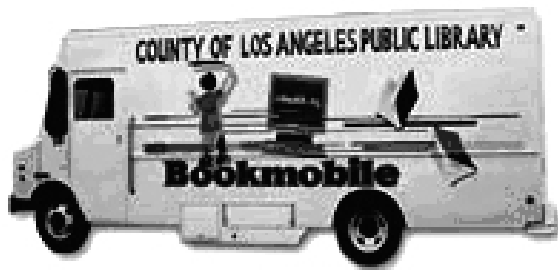
图2 洛杉矶县流动图书馆