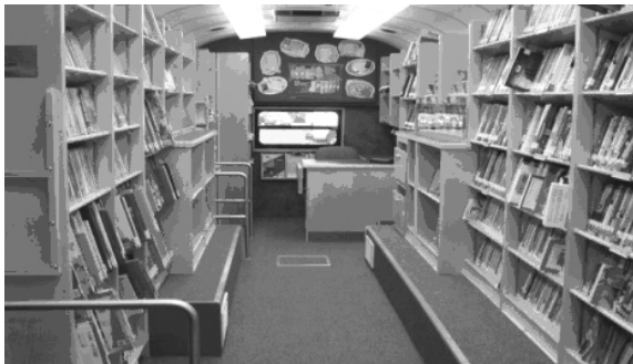
图1 流动图书馆内部

(8)流动图书馆。流动图书馆(见图1、图2)是设计成图书馆的大型巴士,车内有书架、电脑、无线上网等装置,定期开到边远地区,停泊在公园和公共场所,为农村和城市郊区的居民提供服务。