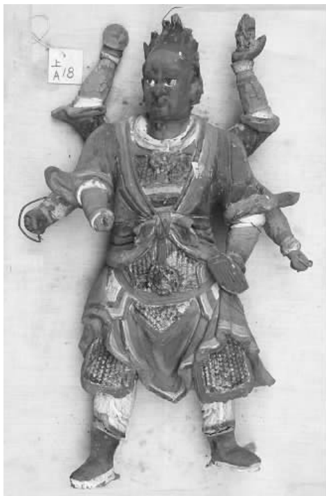
图二 上 A18 号彩塑天蓬形象

仙赴会图》就是其中一幅。《神仙赴会图》是属于道教题材的壁画巨作。据景安宁先生考证,它较著名的永乐宫三清殿《朝元图》壁画的时代还要早。《神仙赴会图》神系的组织结构上承宋代道教神系,下接元代后期的全真神系。壁画的风格和图像与永乐宫三清殿壁画相似,两者同出一个祖本,且《神仙赴会图》是《永乐宫壁画》的先河。景先生在其著作《元代壁画——神仙赴会图》的“四圣”一章中有关于四圣的详细论述。书中写到“永乐宫三清殿东壁也有天蓬,与真武一起站在东壁之首,不过永乐宫的天蓬是两头四臂” [10] 。同时也提及到“站在壁画东壁天蓬旁边的真武身穿黑袍,右手持剑,披发赤足,足下有缠绕在一起的龟和蛇。”在道教诸神中,四大护法神的位置安排通常是两两相对的。可见与黑杀、天猷相对的真武和天蓬相邻,都为北极星君的随从。值得一提的是,景先生与王先生对永乐宫壁画中真武的形象推断不相一致,因此该问题还需进一步考证。