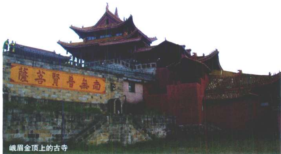
峨眉金顶上的古寺

记得当代禅宗耆宿南怀瑾先生,尝于1943年夏赴峨眉中峰大坪寺闭关阅藏三载。遥想先生当年于青灯古佛旁,潜心梵典,栖志心宗,必有诸多体悟、心得,其与普贤十大愿岂非有夙缘乎?笔者因以一绝记之,其句云:“峨眉兰若夜观经,明月溪山听晚钟。啼鸟一声忽有省,回眸云海见神灯。”■