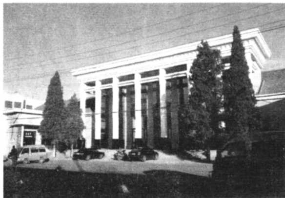
图一〇 大寨展览馆旧址

大寨村现存的现代史迹和代表性建筑物大部保存完好,但由于生产体制的改变,生产生活的需要,部分建筑及文化史迹不同程度地受到破