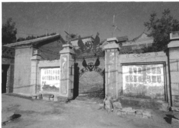
图四 大寨人民公社大院大门