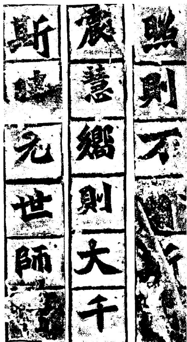
《始平公造像记》(局部)