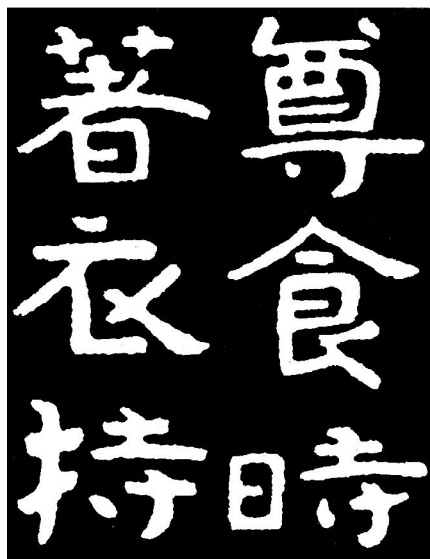
《泰山经石峪金刚经》(局部)

于山东泰安泰山经石峪花岗岩溪床。字大径尺,书体雄浑,以隶为主,间有篆、楷、行草意。其字径大小亦有差别,大多数字为竖高约35厘米,横宽40厘米~60厘米。据民国初年拓本计,存960余字。此摩崖无撰书人姓名,因笔法与山东邹县尖山摩崖《晋昌王唐邕题名》相近,后人便认为是唐邕所书。《泰山经石峪金刚经》多有一些不常见的俗字,如“万”、“无”二字,竟与现在通用的简化字相同。这对于研究我国书体的历史演变和书法艺术成就,具有相当重要的价值。