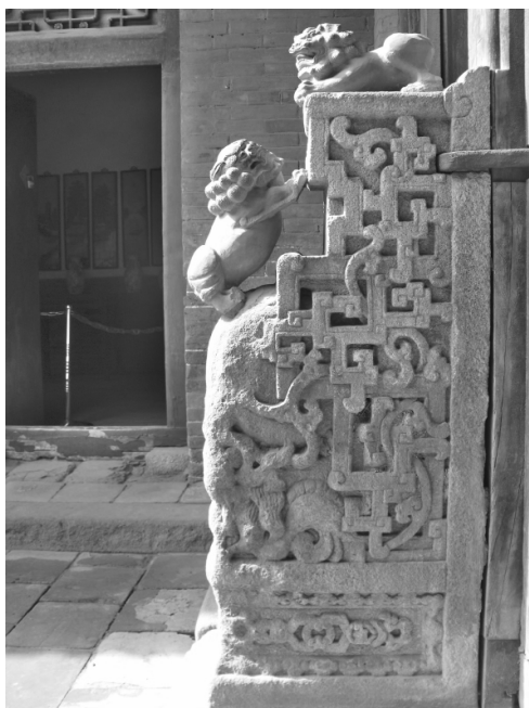
图二 贵和堂夹楼雕花抱鼓石

皆头大脸阔,额隆颊平,箕口肉鼻,前额突出,从秃顶式的头部到项背披有旋式鬣毛,胸饰瓔珞华饰,脖上有铃铛,形态俯首缩足。雌狮多掌柱幼狮,有的还背负其子,雄狮则脚踩绣球,或嘴衔彩蒂,背负绣球,较多地汲取民间传统舞狮艺术的成分,富有很强的乡土气息和喜庆风格。石狮底座都雕刻吉祥纹饰,或是刻寓言典故图案作装饰。如常氏宗祠前的一对门墩石狮,石狮形象具有典型的清代北方石雕特色。其雕刻运用夸张的手法,石狮造型头大尾短、低首咧口,身浑圆、腿短,鼠毛蓬卷,卷毛、铃挡等装饰细腻丰富,眼、口、鼻、尾的细部刻画简略。在艺术风格上更为丰富多彩,造型乖巧活泼,更富有人情味。石狮底座采用浅浮雕线刻手法,三面都刻有“孔子讲学”的场景,反映了庄园主人深受儒家文化的影响,注重子孙的教育,也是对家训“学而优则贾”的巧妙体现(图一)。