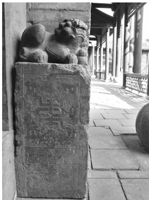
图三 人和堂门前的书籍形门墩石

圆鼓形门墩在常家庄园门墩石中也为数不少,大部分造型较为简洁,以青石为主,雕刻上以圆雕、浅浮雕、线刻为主,题材上大多都是吉祥纹样或瑞兽纹样。也有部分造型复杂的抱鼓石。如贵和堂夹楼牌雕花抱鼓石,造型巧夺天工。整个门墩高142厘米,宽22厘米,长56厘米,抱鼓的