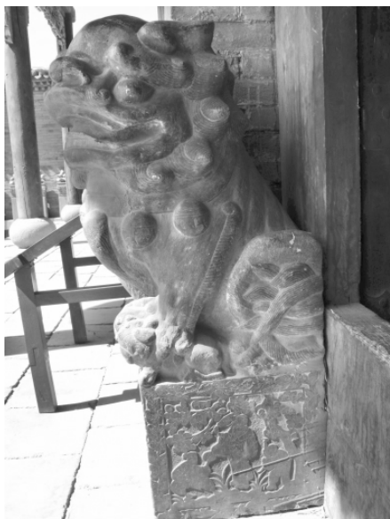
图一 常氏宗祠大门门墩石