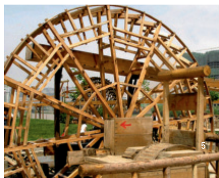
甘肃兰州黄河水车 段续创始于明嘉二年(公元1523年)甘肃著名水利设施文化遗产)

②我们设计完成了以不锈钢为物质载体的以水车为原型的雕塑小品,体现了五行之水文化与甘肃黄河水车文化相结合的强烈的地域性特色。