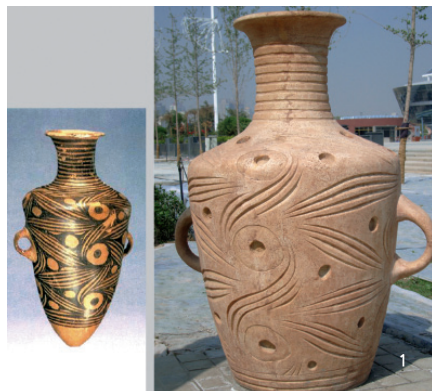
旋涡纹彩陶尖底瓶（新石器时代——马家窑文化，泥质红陶彩陶珍品。）甘肃省博物馆藏 甘肃陇西出土