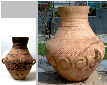
漩涡纹彩陶双耳罐(新石器时代——辛店文化,泥质红陶彩陶珍品。)甘肃省博物馆藏 甘肃临洮辛店遗址出土

①辛店文化源于马厂类型,由裴文申先生1947发现。辛店文化早期遗存与齐家晚期遗存有十分明显的继承发展关系,是西北甘肃地区一支重要的文化遗存,时代距今3100年~2800年前后。整个辛店文化从商代一直延续到西周晚期。