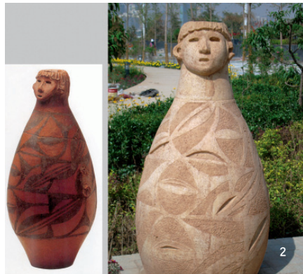
彩陶人头器口瓶（新石器时代——仰韶文化，庙底沟类彩陶珍品。）甘肃省博物馆藏 甘肃秦安大地湾遗址出土