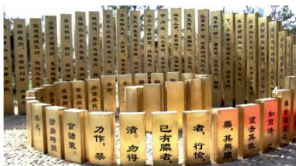
甘肃武威汉简 统称武威汉简,包括《仪礼》简、王杖诏令简和医药简牍等文化遗产。