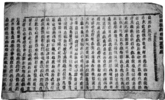
图一 西夏文泥活字印本《维摩诘所说经》图片

北宋庆历以后,活字印刷虽有使用,但技术上仍然存在一定难度,所以活字印刷法在发明之初没有被普遍采用。在汉文古籍中我们至今没有发现宋代活字印本。所幸的是,在俄罗斯藏黑水城出土和武威市亥母洞遗址出土的西夏文佛经中,为我们提供了第一手的原始资料。史金波、黄润华在《中国历代民族古籍文字文献探幽》 ② 中记述:“黑水城出土的西夏文献中有活字版《维摩诘所说经》(上、中、下),共330余面。武威市亥母洞遗址也出土了西夏文活字版《维摩诘所说经》(下卷)图一 ③ ,共54面。两地所出都有西夏仁宗