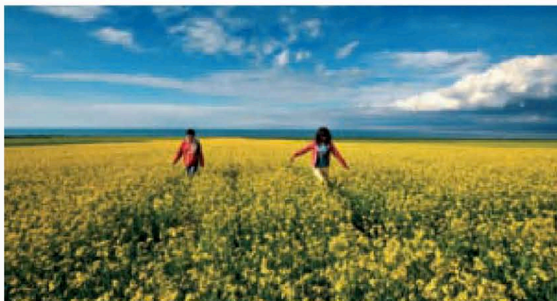
◆ 青海湖边万亩油菜花