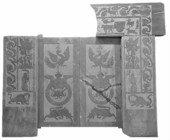
图三 “隰城遗址墓门石” 发掘出土于柳林县穆村镇杨家坪

“隰城遗址”这一组墓门石与“西河郡太守墓”墓门石在雕刻手法上有所不同。吕梁境内汉画像石是以浅雕墨描技法为主,一般不在细部作雕刻,仅用流畅准确的墨线将细部加以描绘。这种浅凸雕作品的拓片效果细腻传神,潇洒飘逸,充满动感和力量。而隰城遗址墓门石则采用了深剔地雕刻技法,在物像细部也施以刀刻,这种技法剔地较深,拓片效果宛若剪影,凝重深沉,明快醒目。在画面内容方面也继承了陕北一带的风格,赋予作品焕然一新的视觉效果。这也是晋陕秦汉之好的有力见证。门楣石只有半块,这是吕梁市屈指可数的反映农牧生产的画像石之一。画