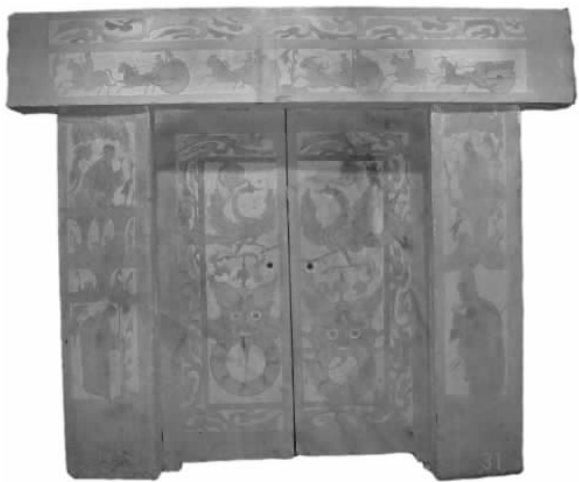
图一 “西河郡太守墓” 1997年4月发掘出土于离石交口镇石盘村

较浅,有的画像石用手去触摸稍有感觉。车马佩饰的细部(轮廓内)全部不作雕刻,用娴熟纤细的墨线勾勒,把人物、动物的神态感情表现出来。虽然细部不作雕刻,但给人的印象和艺术效果是完整的。在题材内容上也比较丰富,有神话传说、典章故事、宗教信仰,有反映汉代人生产、生活以及风俗习惯等。画像石在构图内容、雕刻技法上类同,雕刻完工之后,在凸起的物象上加施彩色,出土时墨线清晰,所施色彩保存完好。施彩有平涂也有点染,彩色有朱红、赤色、白色、粉色,所施色彩浓淡相宜,使得画面更加活泼、明快醒目,产生出独特的艺术风格。如图一所示“西河郡太守墓”,1997年4月发掘出土于离石交口镇石盘村。该墓由门楣石、门框石、门扉石所组成。“门楣石”所绘刻的图画为车马出行图。车马出行在汉墓中几乎墓墓都有,它反映了汉代贵族的入朝、出访、互拜、祭祀等生活情景。在出行过程中,车辆的类型、数量是墓主人身份、地位、权势、财富的一种显露。车马出行向左行驶,依次为导骑一名,开道轺车两辆,主车一辆,从骑一名,栈车一辆。轺车是一种撑有伞盖的车,车上设有座位,一般为县、州一级的官员使用;驭手驾车居右,而乘车主人在左。栈车通常为载货物的车,由骡马来拉,有时也可乘人。