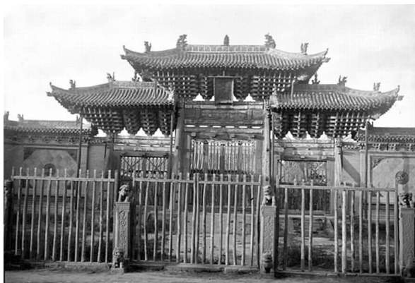
大同府文庙极星门(1907年沙畹摄)

斯文” [18] 。按耶律楚材年龄推断《云中重修宣圣庙》应创作于灭金前后。据此,元初就开始重修西京(大同)庙学。