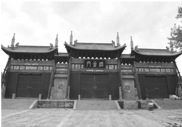
重建后的大同府文庙极星门