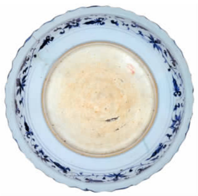
图五// 青花蓝地白花麒麟凤纹菱花口盘底

内饰折枝牡丹一株,内壁饰缠枝菊纹,口沿内外及足墙上绘回纹边饰,外壁饰缠枝牡丹纹。景德镇御窑厂遗址出土有纹样相同的青花碗标本。