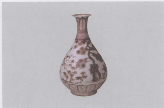
3.釉里红松竹梅纹玉壶春瓶