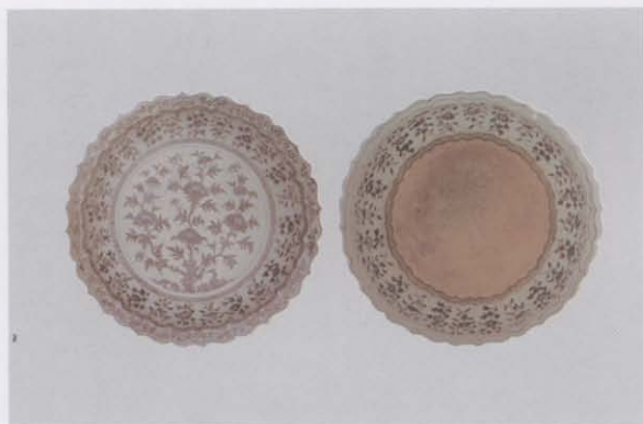
2.青花菊花牡丹纹菱花口折沿菊瓣式盘