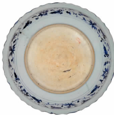
图八// 永乐青花缠枝花菱花口盘底

武时期是否已有官窑生产的问题主要有以下几种看法。一是洪武二年说,其依据主要是成书于清代乾隆时期,由志书录述而来的蓝浦《景德镇陶录》卷一所记“洪武二年,就镇之珠山麓设御窑厂,置官监督烧造解京”。同书卷五亦有“洪武二年,设厂于镇之珠山麓。制陶供上方,称官窑,以别民窑” [40] 的记载。二是洪武二十六年(1393年)说,即前述《明会典》所载“洪武二十六年定……或数少,行移饶、处等府烧造” [41] 。三是洪武三十五年(建文四年,1402年)说,依据是明王宗沐《江西大志·陶书》:“洪武三十五年,始开窑烧造,解京供用,有御器厂,厂东为九江道,有官窑。” [42] 清朱琰《陶说》亦引王书的观点。而现藏景德镇陶瓷馆刻于明崇祯十年(1637年)《关中王老祖鼎建貽休堂记》碑刻亦记有“我太祖高皇帝三十五年,改陶厂为御器厂,钦命中官一员,特董烧造” [43] 。此说认为明代御器厂是由洪武早期就存在的“陶厂”发展而来。笔者认为无论哪种看法,洪武时期景德镇已存在官府督烧