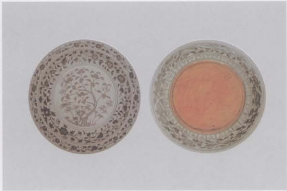
4.釉里红园景芭蕉纹敞口折沿盘