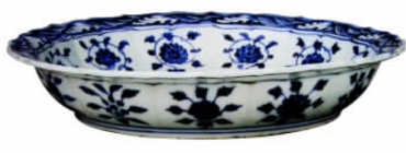
图六// 永乐青花缠枝花菱花口盘形