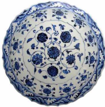
图七// 永乐青花缠枝花菱花口盘心