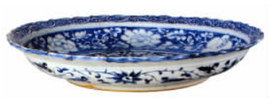
图三// 元青花蓝地白花麒麟凤纹菱花口盘