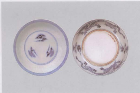
5.青花印花云龙纹盘