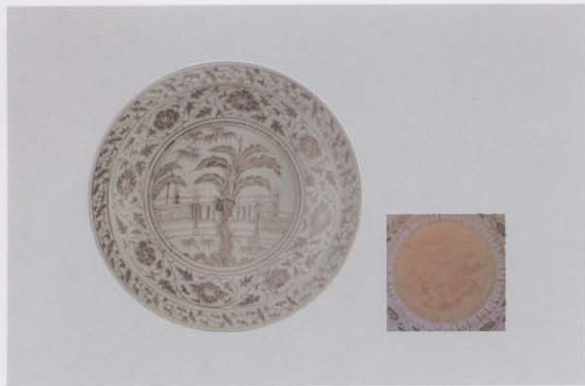
1.青花石榴竹石纹敞口折沿盘