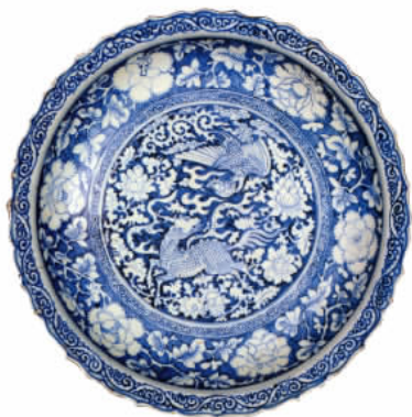
图四// 元青花蓝地白花麒麟凤纹菱花口盘心