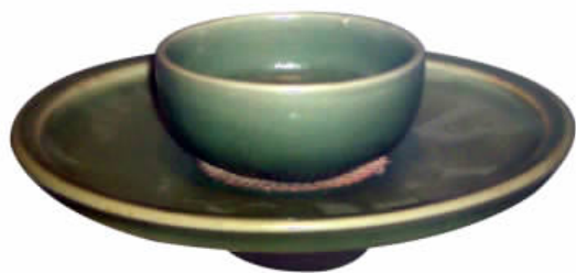
图四// 元末明初龙泉窑青釉带托盏