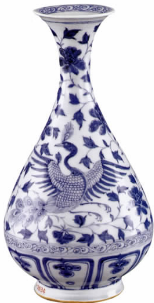
图三// 元青花凤穿牡丹纹玉壶春瓶

2、明洪武青花松竹梅纹梅瓶,高36.5、口径6.4、足径13.4厘米(表一:12)。小口,唇略卷,圆肩,长腹,腹中上部有一道明显接痕,胫部微束,平底内凹成极浅的环形圈足,足外缘有一周不规正的斜削刀痕。白釉微微泛青,肥腴滋润,釉里红发色鲜艳,从颈部至胫部一共绘6层纹饰,依次为:蕉叶纹、卷草纹、缠枝菊花纹、松竹梅纹、海水纹和夹大