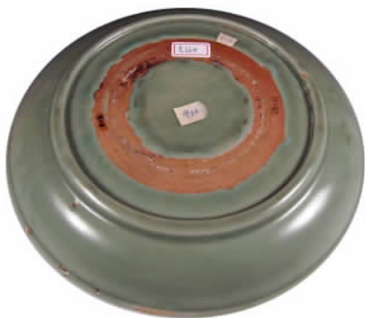
图五// 龙泉窑青釉印花宝杵纹盘底