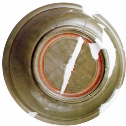
图七// 元代中晚期盘底特征