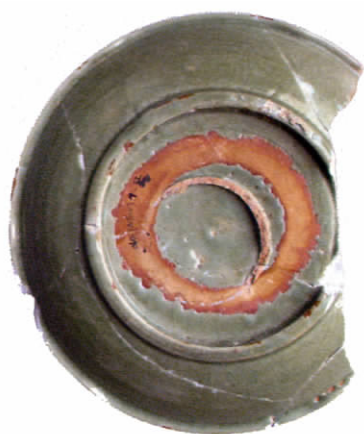
图六// 明代早期盘底特征