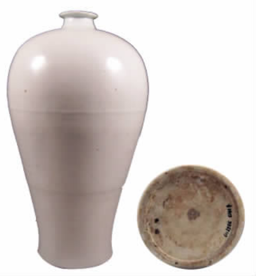
图一// 明洪武十二年吴祯墓出土白釉梅瓶及底