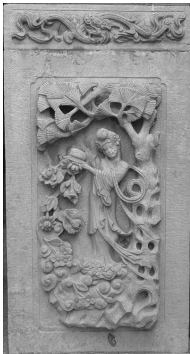
天王殿南掖门天女散花石雕