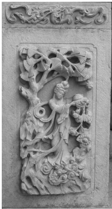
天王殿南掖门天女散花石雕

其中佑国寺天王殿,面阔五间,进深六椽,单檐硬山顶。大雄宝殿是南山寺唯一的一座明代建筑,面阔五间,回廊周匝,单檐歇山顶。雷音殿面阔五间,进深六椽,前出廊,硬山顶。三座大殿结构规范,用材规整,装饰精细,是标准的明清官式建筑,再现了中国明清建筑的辉煌。