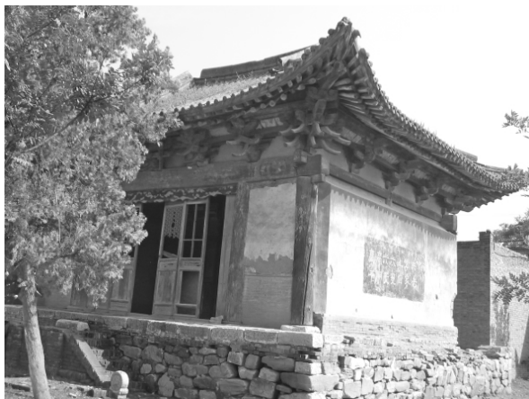
图四 戏台斗拱、立柱

董村戏台坐南朝北,条石台基,平面近似方形(图一),面宽三间,进深四椽,单檐歇山顶(图二),内槽九根垂莲柱与抹角梁搭接荷载(图三),