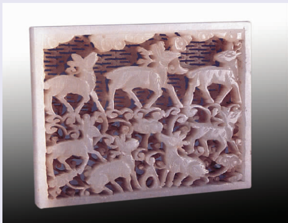
图六 明代“路路顺利”玉带銙

2.“龙凤呈祥”。清代,连环璧。现藏故宫博物院。黄玉龙凤连环璧,以中间方形套环为轴,连以左右两圆璧。一璧正面雕腾云龙,另一璧雕云凤