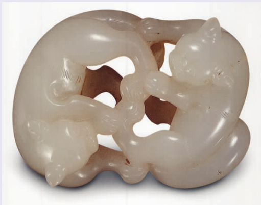
图一〇 清代“恩爱合欢”玉坠

“吉祥图案”之中,还有以天象、节令,与人们的社会生活条件或生存环境休戚相关的,特别是表现嘉庆征兆的题材:喜报春早、六合同春、五谷丰登、三阳开泰、连年有余、江山万代、万象更新