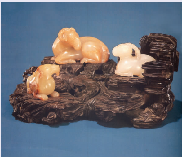
图一五 “三阳开泰”摆件

1.“刘海戏蟾”。通常雕一仙人，用一串钱在嬉戏金蟾。刘海为道教人物，相传其睹异人垒钱之危而悟道成仙，被视为吉星福神。金蟾有吐钱的本事，故而成为招财进宝、日进斗金、财源茂盛的象征。民间把含有钱的金蟾摆放时嘴冲屋内，不含钱的金蟾就冲屋外。