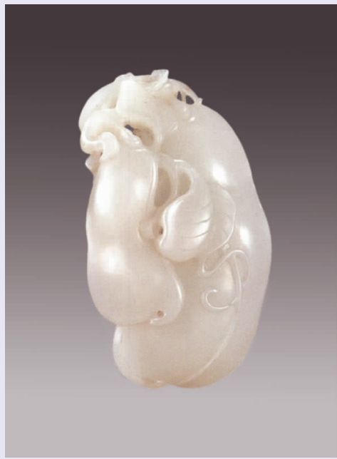
图五 清代“连中双甲”玉豆角挂件

5.“金玉满堂”(图四)：高11.5厘米，现藏北京定陵博物馆。明代，金托玉爵，爵身呈元宝形，流口刻“万”字，尾刻“寿”字，龙把手，两龙间刻一组四合如意云纹，三足立于金盘上，足根部各刻一如意云纹。整个爵身满布云龙纹，构图庄严对称，气魄雄浑。金玉本来就是财富的象征，再雕琢成元宝形，刻有万寿二字，代表了万乘之尊的皇帝。1957年出土于北京十三陵，为明代万历皇帝生前用具。