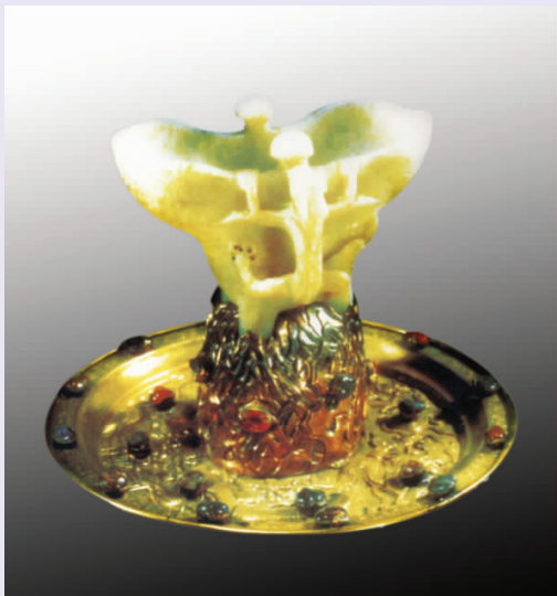
图四 清代“金玉满堂”金托玉爵

4.“三星高照”。清代，玉牌，正面刻寿星骑鹿，游于云间，背面琢五福，正面和背面合一，寓意三星高照，贵人相伴，事事如意。“福禄寿”三星是神化传说中专管人间祸福、官禄、寿命的吉星。