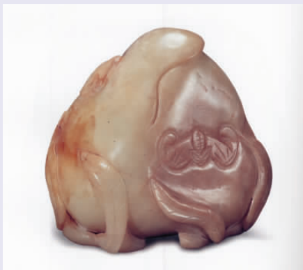
图一 清代“五福捧寿”玉桃

3.“麻姑献寿”(图三)：清代玉牌，高5.8厘米，现藏上海博物馆。双面雕琢，一面草书寿字，另一面琢麻姑。麻姑发髻高耸，衣带飘然，面容慈祥，双手抱美酒，驾云前往天庭。线条流畅自然。