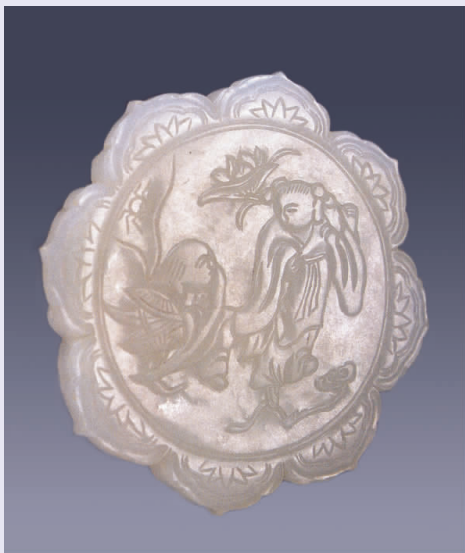
图九 清代“和合二仙”玉佩

纹,寓龙凤合璧、龙凤呈祥。古人认为龙能祛邪致福,而凤是一种象征祥瑞之鸟;玉器装饰龙凤纹样历史久远,明清龙凤纹样丰富而巧妙。