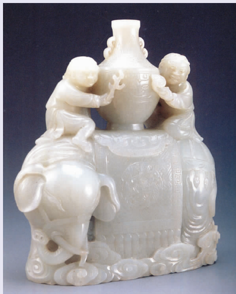
图一六 清代“太平有象”

尤其是当玉器步入百姓之家并与乡土文化紧密结合后，它更加成为一种富贵平安、兴旺吉庆的象征物了，从而使得尊玉、爱玉的传统观念