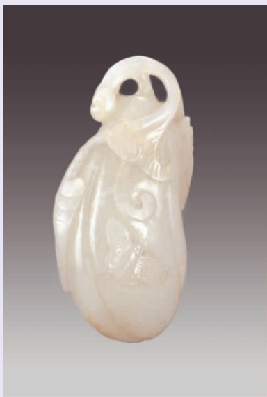
图一三 清代“瓜瓞绵绵”玉挂件

表现招财、辟邪、神佛的题材明清时期非常流行。如金蟾、貔貅、观音、佛像、关公等,在民间有“男戴观音女戴佛”、“刘海戏金蟾”等说法,祈求天地神灵对人们身体、生活的保佑。