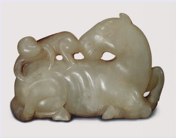
图七 清代玉带扣“马上封侯”