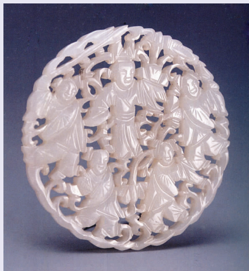
图八 清代“五子登科”玉花片