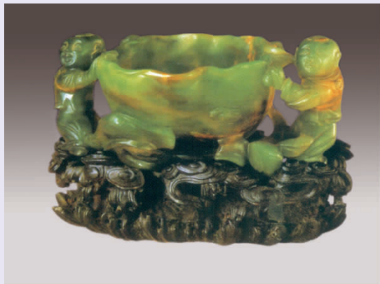
图一一 清代“连生贵子”碧玉洗