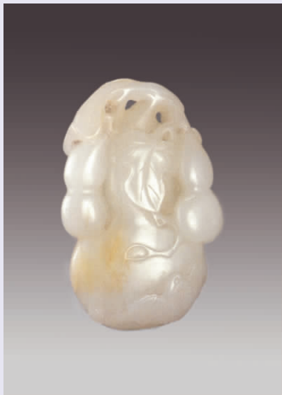
图一四 清代“福禄万代”玉件