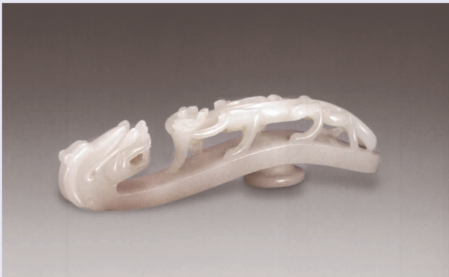
图一二 清代“望子成龙”玉带钩